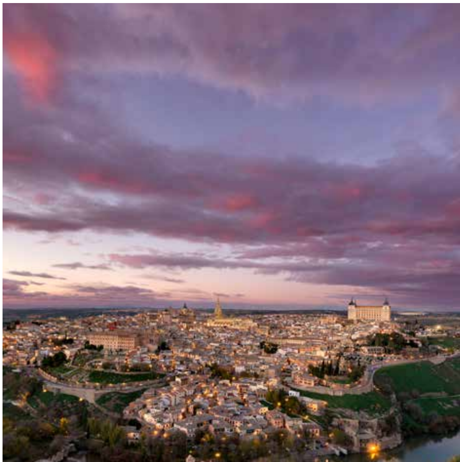
Panorámica de Toledo