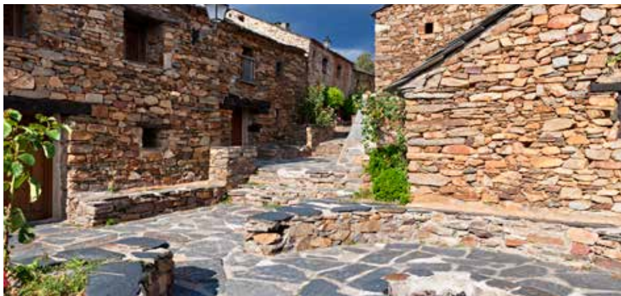
Hayedo de Tejera Negra en el Parque Natural Sierra Norte de Guadalajara y Umbralejo, Pueblos de la Arquitectura Negra