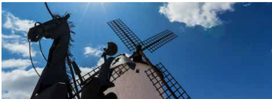
Fachada renacentista del Ayuntamiento de El Bonillo, y Molino de viento, Munera.